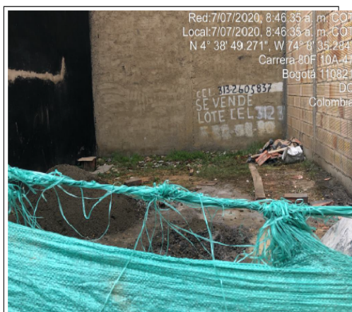
Fotografía No. 1. Acopio de materiales de construcción en predio con CHIP AAA0148KRT0.