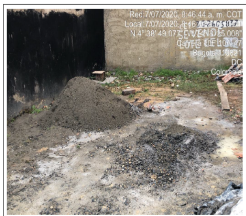
Fotografía No. 2. Mezcla de cemento en Predio con CHIP AAA0148KRT0.